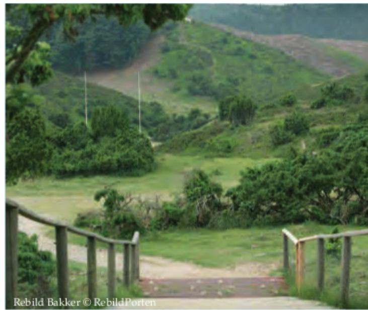
Rebild Bakker

Gravlev Sø - genskabt efter 100 års tørlægning. [63] Gravlev Sø dominerer igen ådalen sammen med den slyngede Lindenborg Å. Den lavvandede sø tiltrækker mange rastende fugle, og sammen med talrige kilder og kildebække er ådalen absolut et besøg værd. En rundtur omkring søen på 6-7 km passerer 5 store kilder og giver mulighed for at opleve blandt andet odder, vandstær, isfugl og bjergvipstjert.